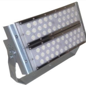
100 W / 120 W