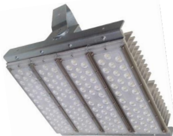
200 W / 240 W