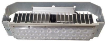
50 W / 60 W