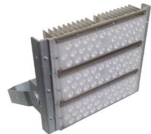
150 W / 180 W