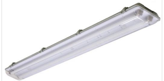
2 LÂMPADAS LED HO 40W + CALHA HERMÉTICA