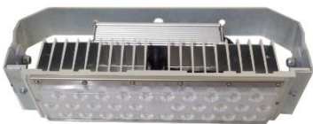
HERMÉTICA A LED 50 W – ESTIL LED