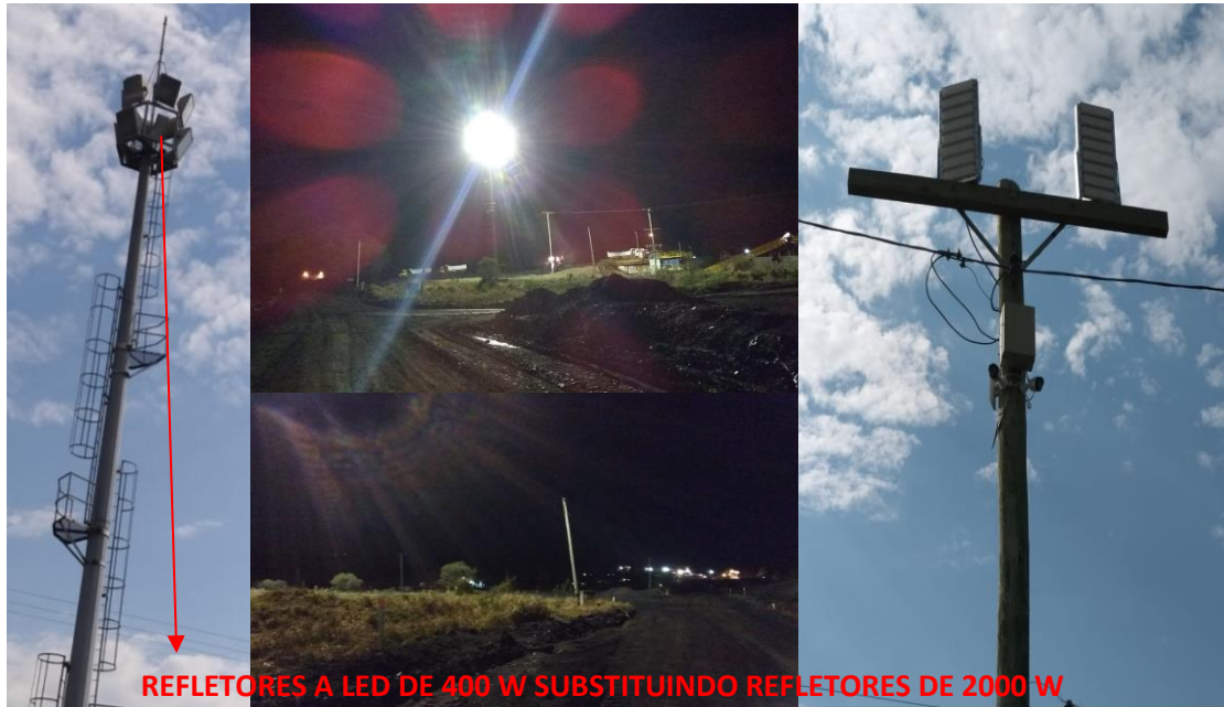
REFLETORES A LED DE 400 W SUBSTITUINDO REFLETORES DE 2000 W